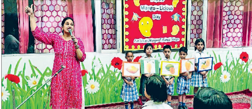
जीड। कार्यक्रम में भाग लेते बच्चे।

आम की कुल्फी, आम की खीर, आम का पन्ना, आम का सैंडविच, आम का हलवा आदि रहा। अंत में