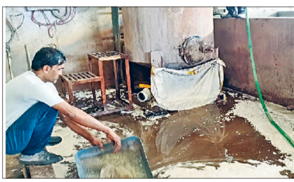
जींद। फैक्टरी में फैली गंदगी।

सीएम फ्लाइंग तथा पॉल्यूशन विभाग ने रघुनगर में छापेमारी कर बिना पॉल्यूशन विभाग की अनुमति के प्लास्टिक दाना बनाने की फैक्टरी को पकड़ा है। बैटरियों की स्क्रेप से प्लास्टिक दाना बनाया जा रहा था। फैक्टरी में नियमों को भी ताक में रखा जा रहा था। मौके पर दस टन बैटरी स्क्रेप भी पाई गई। दस्तावेज न पाए जाने पर पॉल्यूशन विभाग ने फैक्टरी मालिक को नोटिस जारी किया है। आगामी कार्रवाई पॉल्यूशन