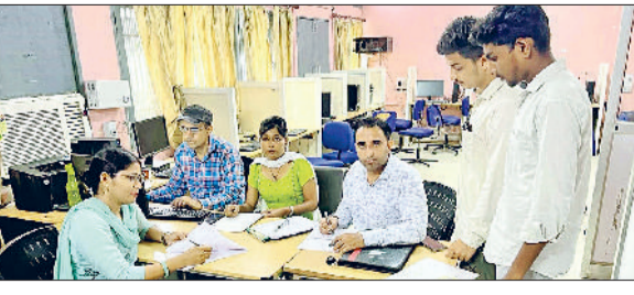
जीड। आईटीआई में दाखिला लेने आए छात्र।

राजकीय औद्योगिक प्रशिक्षण संस्थान आईटीआई जीड और राजकीय महिला आईटीआई जीड में शैक्षणिक सत्र 2025-26 के लिए प्रवेश प्रक्रिया जारी है। विभाग द्वारा जारी की गई तीसरी मेरिट सूची के अनुसार राजकीय आईटीआई जीड में 297 विद्यार्थियों और महिला आईटीआई में 13 विद्यार्थियों का चयन किया गया है। चयनित अभ्यर्थियों को 26 जुलाई तक दस्तावेज सत्यापन करवाना होगा। जबकि फीस जमा करने की अंतिम तिथि 27 जुलाई निर्धारित की गई है।