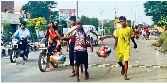
कैथल। कांवड लेकर आते शिवभक्त।