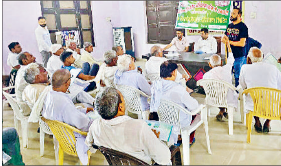
कलायत। किसानों को जानकारी देते विज्ञानी।