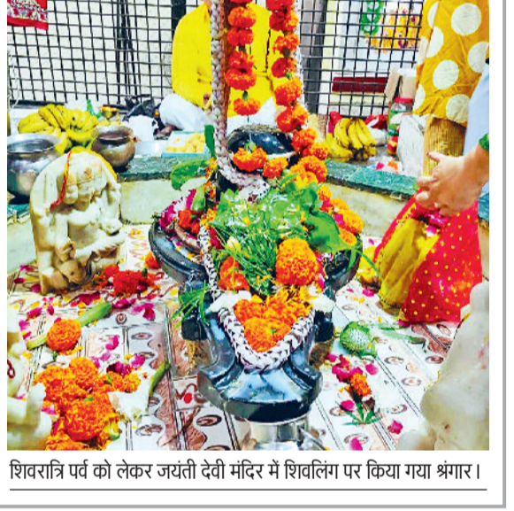
शिवरात्रि पर्व को लेकर जयंती देवी मंदिर में शिवलिंग पर किया गया श्रंगार।