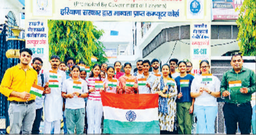
जीड। कार्यक्रम में भाग लेते बच्चे।