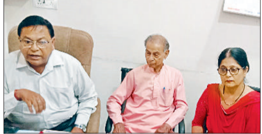
जीड। पत्रकारों से बातचीत करते संस्था के पदाधिकारी।