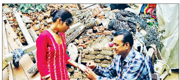
जीड। बीमार लोगों के खून के सैपल लेती टीम।