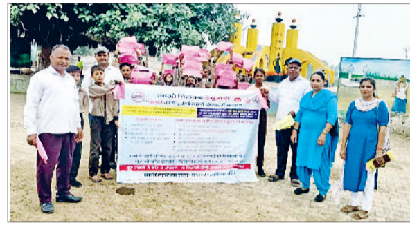
चंद्रपुर गांव में डेगू से बचाव प्रति जागरूकता रैली निकालते स्कूली बच्चे व स्वास्थ्य कर्मचारी।

प्रधानाचार्य ने अपने संबोधन में आम की खूबसूरती व इसके पोषक तत्वों की विशेषताओं के बारे में सभी विद्यार्थियों को अवगत करवाया।