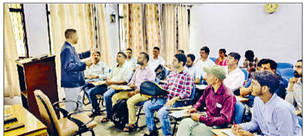
जीड। प्रशिक्षण देते हुए।