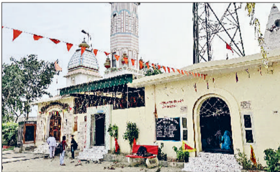
न्यू प्रगति स्कूल में मनाई शिवरात्रि

की वारदातें सामने आ रही है। लोग खुद को पूरी तरह असुरक्षित महसूस कर रहे हैं। उन्होंने कहा कि भाजपा सरकार हर मोर्चे पर जनता के खिलाफ नजर आ रही है। भाजपा अपने चुनावी वादों को पूरा करने की बजाय सरसों के तेल व बिजली दामों में बढ़ोतरी, सरकारी भर्तियां रद्द करने, युवाओं और कर्मचारियों की आवाज दबाने कार्य कर रही है।