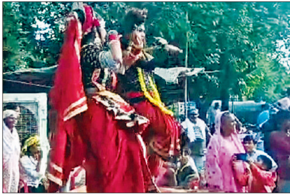
कैथल। भगवान शिव के भजनों पर झूमते कलाकार।