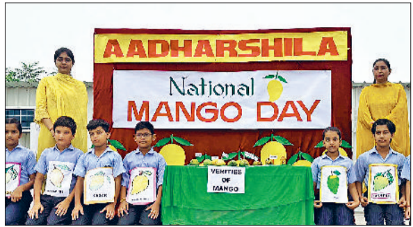
जीड। मैंगो डे मनाते हुए बच्चे।