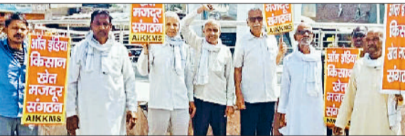
ढांड। नारेबाजी कर रोष जताते आल इंडिया किसान खेत मजदूर संगठन के सदस्य।